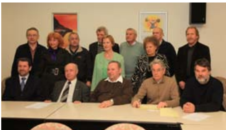
Del udeležencev ustanovnega zbora Društva Pionir, 11. februarja 2010