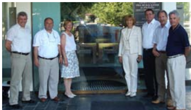
Udeleženci prve seje upravnega odbora, 14. junija 2010