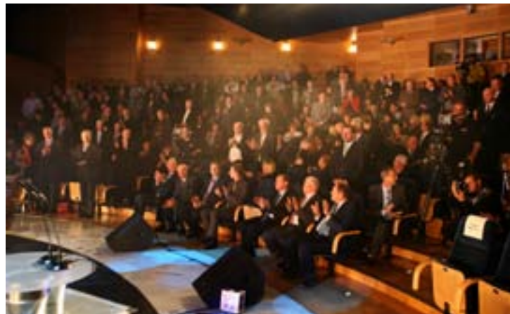
Nekdanji Pionirjevci na slovesnosti ob 60. letnici Kovinotehne MKI, I. 2009

Seveda je, kot kamen, skala, kost smo se igrali igrico v časih, ko še ni bilo televizije, ne računalnikov, ko je cela vas ali ulica imela eno žogo.