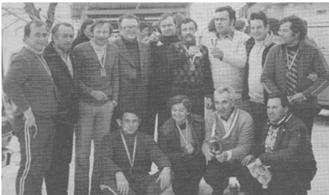
Prijetna in nepozabna druženja Pionirjevcev so bila vedno tudi na športnih dnevih.

Prosimo vse, ki bi želeli kaj povedati, kaj komentirati, zapisati pred pozabo, da nam to sporočite na spletno pošto: info@društvo-pionir.si